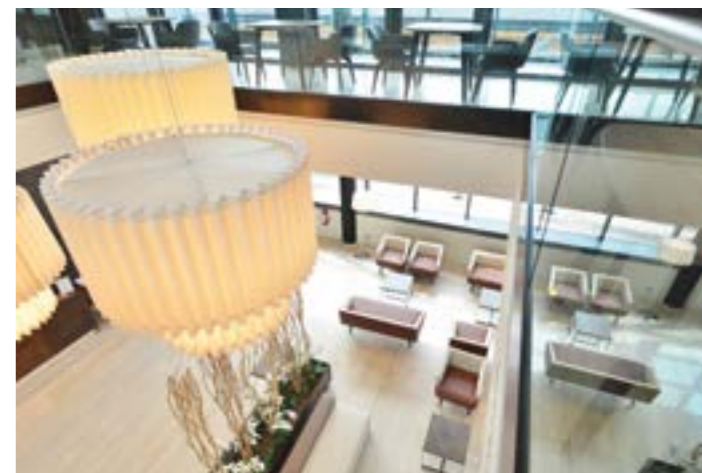
Hilton Garden Inn, Milano, Ottobre/Novembre